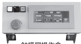
触摸屏操作盒 タッチ操作パネル Touch Panel